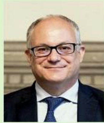
Roberto Gualtieri Sindaco di Roma