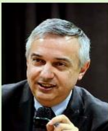
Maurizio Molinari Direttore La Repubblica