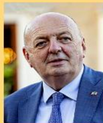
Gilberto Pichetto Fratin Ministro dell'Ambiente e della sicurezza energetica