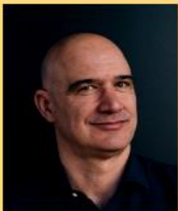
Giacomo Papi Scrittore