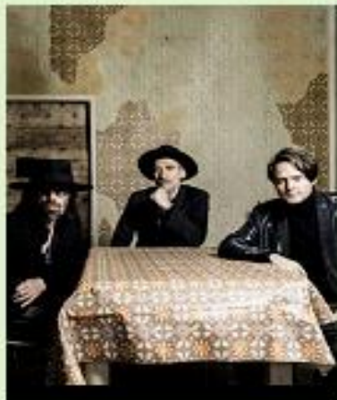
Marlene Kuntz Gruppo musicale