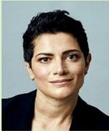
Francesca Cavallo Scrittrice