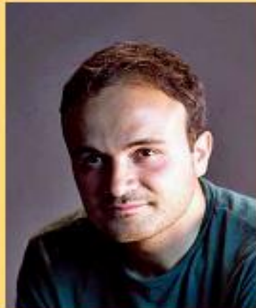
Paolo Di Paolo Scrittore