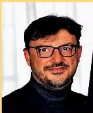
Eugenio Patanè Assessore alla Mobilità di Roma