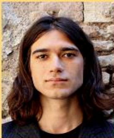
Giacomo Mazzariol Scrittore