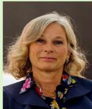
Giovanna Melandri Presidente della Fondazione MAXXI